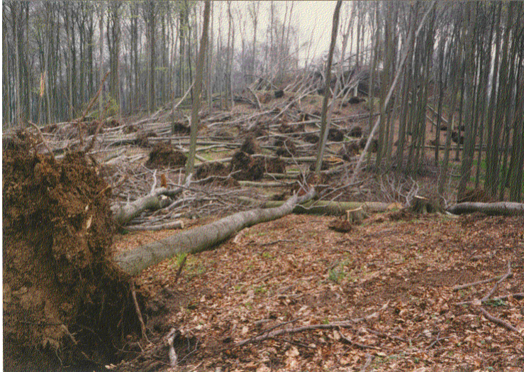
Abb. 3 Nach dem Wintersturm Wiebke (Büdingen Wald, März 1990).