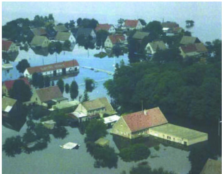
Abb. 4 Oderhochwasser Juli 1997