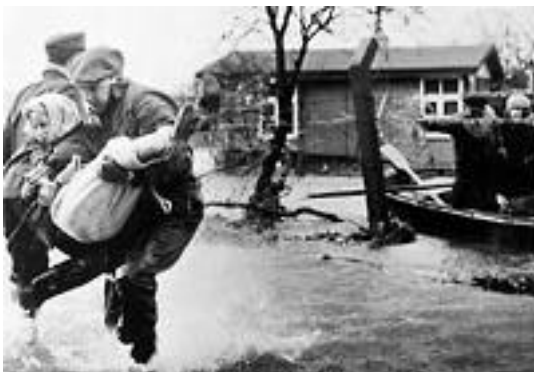
Abb. 2 Sturmflut nach Hamburg-Orkan 1962.